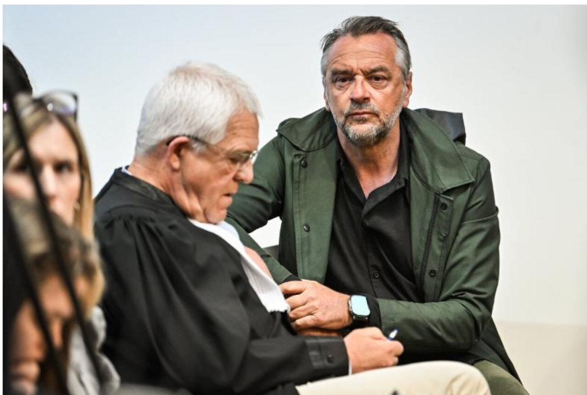
ANTWERPEN, BELGIUM - MAY 05 : Proces Tom Waes pictured on May 5, 2025 in ANTWERPEN, BELGIUM, 05/05/2025