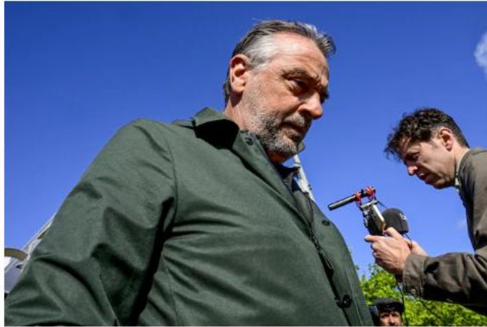
Tom Waes.

Volgens de experts heeft het imago van Waes inderdaad een deuk opgelopen maar is de schade niet onherstelbaar. Pakt de VRT de rehabilitatie goed aan, dan heeft de omroep haar populaire schermgezicht terug.